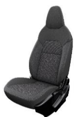
Acenta Sort stofindræk