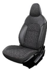
N-Connecta Sort stofindræk med sorte detaljer