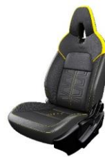
N-Sport Sort dellæder og gul Alcantarabetræk