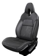
Tekna Sort kunstlæder med quilted/præget mønster