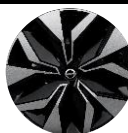
17" 2-tonede stålfælg